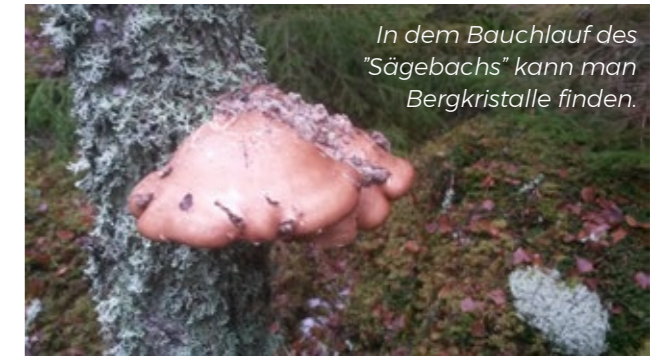
In dem Bauchlauf des "Sägebachs" kann man Bergkristalle finden.