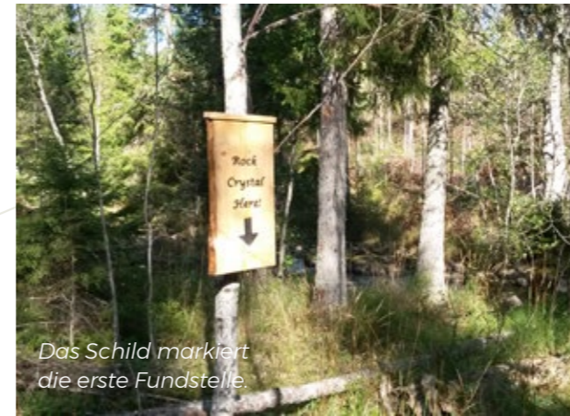
Das Schild markiert die erste Fundstelle.

An der ersten Fundstelle der Bergkristalle gibt es nicht mehr viele zu finden, weshalb wir zu unseren kleinen, geheimen Orten gehen. Hier besteht eine größere Wahrscheinlichkeit viel größere und schönere Kristalle zu finden. Wir beeilen uns nicht, da wir gleichzeitig die Natur genießen. Unser Guide berichtet Dir über die Entstehung der Schlucht und vielleicht zeigt er Dir geeignete Orte, an dem Du etwas Gold waschen kannst.