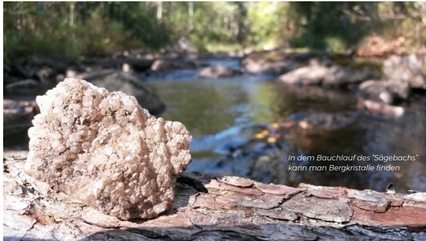
In dem Bauchlauf des "Sägebachs" kann man Bergkristalle finden