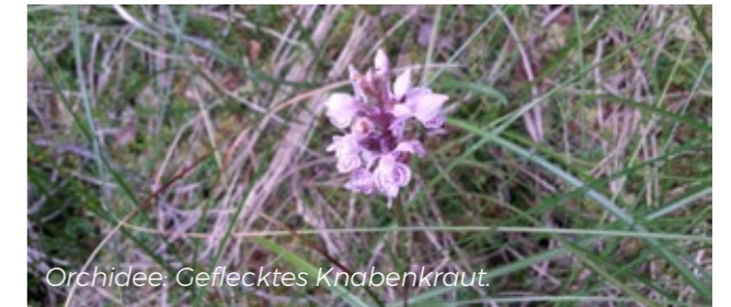
Orchidee: Geflecktes Knabenkraut.